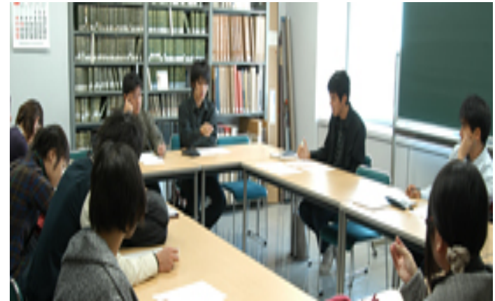
<史学会の活動風景>